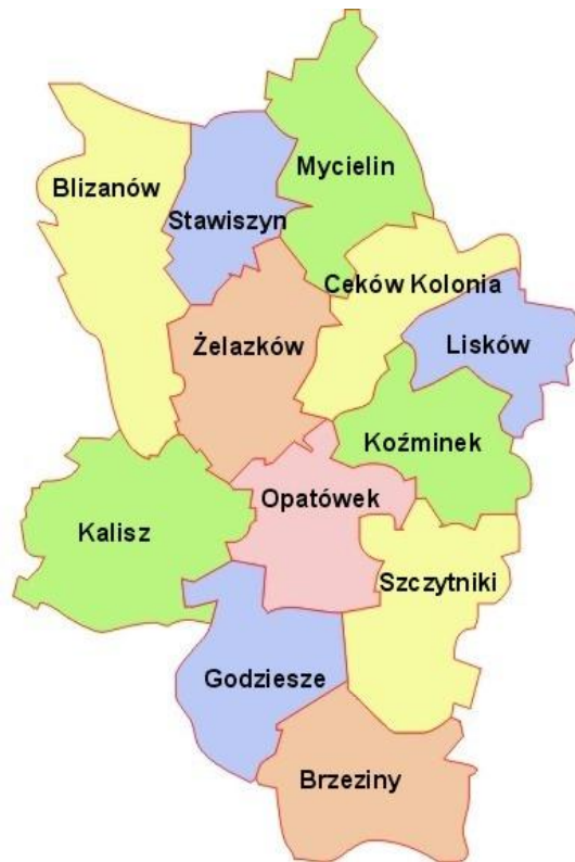
Mapa Powiatu Kaliskiego z podziałem na gminy

Gmina i Miasto Stawiszyn leży w północno-wschodniej części Powiatu Kaliskiego. Zajmuje powierzchnię 7.300 ha. i zamieszkuje ją 9600 tys. mieszkańców. Swoim obszarem gmina obejmuje 14 wsi sołeckich, na terenie, których znajduje się 830 indywidualnych gospodarstw. Ponad 2 tys. ha. powierzchni gminy zajmują lasy.