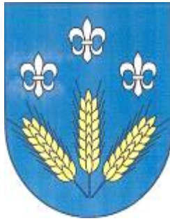
Herb Gminy Godziesze Wielkie

Gmina Koźminek położona jest na wschód od Kalisza. Zajmuje 8.840 ha powierzchni. Na jej terenie znajdują się 24 sołectwa, które zamieszkuje ok. 7.600 mieszkańców. Gmina Koźminek ma charakter rolniczy. Funkcjonuje tam ok. 1100 gospodarstw.