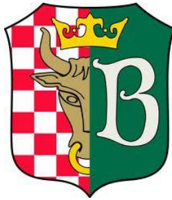
Herb Gminy Blizanów

Gmina Brzeziny Położona w dorzeczu Proсны ma charakter rolniczo-turystyczny. Jej powierzchnia wynosi 12.700 ha, z czego 5.340 ha zajmują lasy. Gmina liczy blisko 6 tys. mieszkańców. Ze względu na walory środowiskowe na terenie gminy utworzono dwa rezerwaty przyrody Brzeziny i Olbina. Rezerwaty utworzone zostały w 1958 roku.