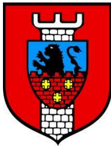
Herb Gminy Koźminek

Gmina Koźminek położona jest na wschód od Kalisza. Zajmuje 8.840 ha powierzchni. Na jej terenie znajdują się 24 sołectwa, które zamieszkuje ok. 7.600 mieszkańców. Gmina Koźminek ma charakter rolniczy. Funkcjonuje tam ok. 1100 gospodarstw.