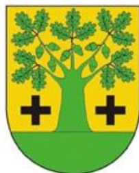
Herb Gminy Mycielin

Gmina Mycielin położona jest w północno-wschodniej części Powiatu Kaliskiego. Obejmuje obszar 11 tys. ha., zamieszkiwany przez ponad 5 tys. osób. Na terenie gminy znajduje się 16 wsi sołeckich skupiających 820 gospodarstw rolnych.