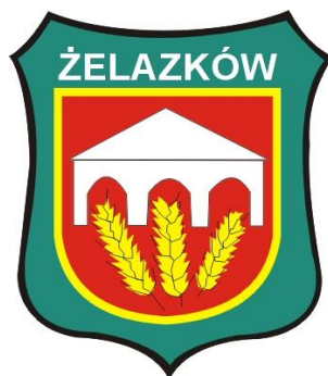
Herb Gminy Żelazków

Gmina Żelazków położona jest na północ od Kalisza. Zajmuje obszar 11.360 ha, podzielony na 25 wsi sołeckich. Teren gminy zamieszkuje 8900 mieszkańców. Gmina ma charakter rolniczy. Użytki rolne zajmują 9,5 tys. ha.