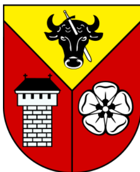
Herb Gminy Szczytniki

Gmina Szczytniki położona jest na południowo-wschodnim krańcu Wysoczyzny Kaliskiej. Obecnie na jej obszarze wynoszącym prawie 11.100 ha. znajduje się 29 wsi sołeckich. Na terenie gminy mieszka ponad 8100 osób. Prawie cały obszar gminy zajmują użytki rolne.