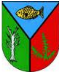
Herb Gminy Brzeziny

Gmina Brzeziny Położona w dorzeczu Proсны ma charakter rolniczo-turystyczny. Jej powierzchnia wynosi 12.700 ha, z czego 5.340 ha zajmują lasy. Gmina liczy blisko 6 tys. mieszkańców. Ze względu na walory środowiskowe na terenie gminy utworzono dwa rezerwaty przyrody Brzeziny i Olbina. Rezerwaty utworzone zostały w 1958 roku.